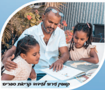
מאפיין ייחודי ללימוד קריאת ספרים