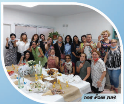
צוות מובילי שפה