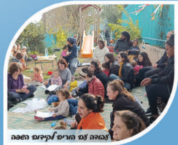
זמורה עם הורים לקידום השפה