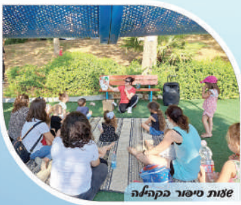
צוות סיפור בקהילה

תוכנית "עיר מדברת שפות", אשר מטרתה קידום שיטות ייחודיות ללימוד השפה העברית לעולים חדשים וילדים דו לשוניים, זאת לצד העשרה וקידום השפה העברית בקרב דוברי עברית שפת אם.