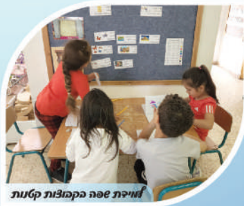
למידה שפה בקבוצות קטנות