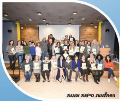
השתתפות סייגות ואמנות