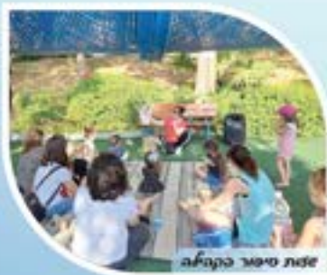
עדת סיפור בקהילה

תוכנית "עיר מדברת שפות", אשר מטרתה קידום שיטות ייחודיות ללימוד השפה העברית לעולים חדשים וילדים דו לשוניים, זאת לצד העשרה וקידום השפה העברית בקרב דוברי עברית שפת אם.