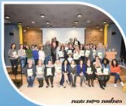
התחלונת סיומת ולגות