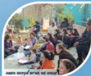
סבאום עם הורים לקניס השפה