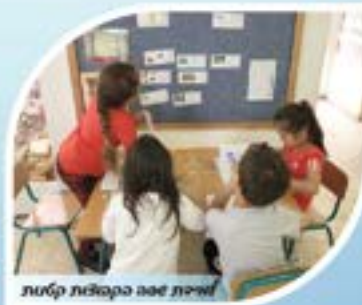
לשית עם בקבוצת קטנת