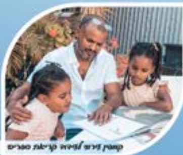
קונטקט צמוד לילדים קריאת ספרים